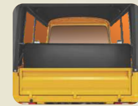
లగేజ్ పెట్టుకునేందుకు అదనపు స్థలం