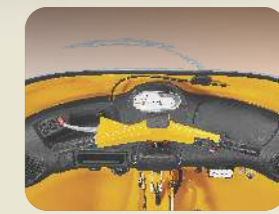
స్టైలిష్ డ్యాష్ బోర్డు