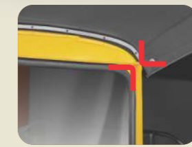
అత్యున్నత బల్డ్ క్వాలిటీ