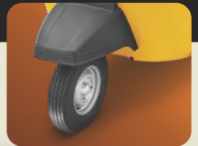
3 వీలర్ ఐభాగంలో మొట్టమొదటిసారి టూచిలెస్ టైర్లు